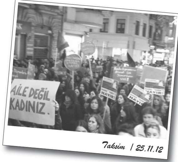
Taksim / 25.11.12

Kadınlar, hapishane duvarının yanından geçerken tel