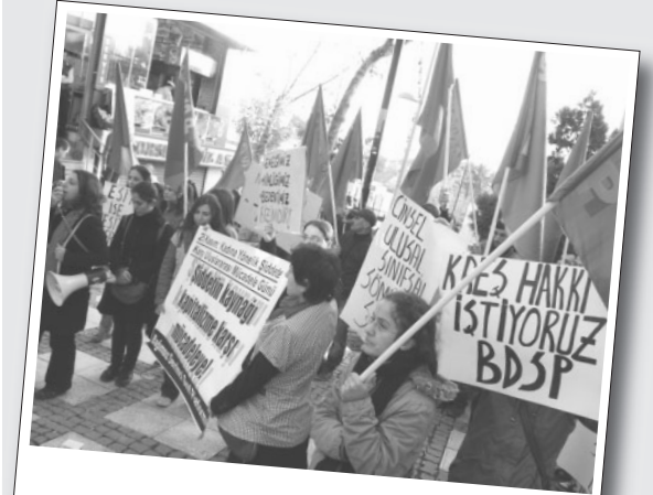
Avcılar / 25.11.12

25 Kasım Kadına Yönelik Şiddete Karşı Mücadele Günü vesilesiyle BDSP tarafından, gerçekleştirilen yürüyüşlerle kadına yönelik şiddete dikkat çekildi. İzmir ve İstanbul'da yapılan eylemlerde “Çözüm devrimde kurtuluş sosyalizmde!” şiarını öne çıkaran sınıf devrimcileri, 25 Kasım'ın tarihini anlatan konuşmalar yapıp çifte sömürüye karşı sosyalizmin kurtuluş olacağını vurguladılar.